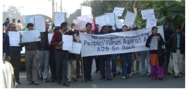
南亚公民团体坚持认为，亚行破坏了其保障政策，并逃避公众问责。